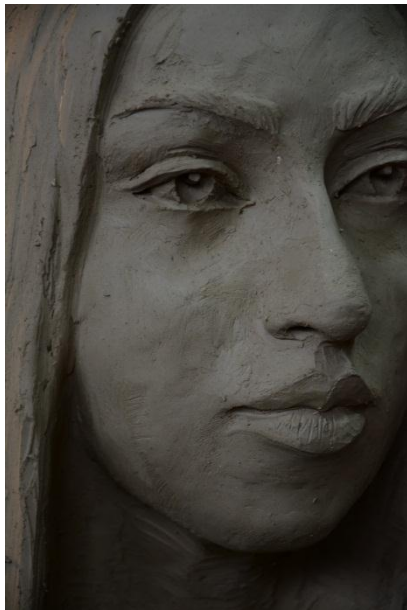
شكل ( 19 )