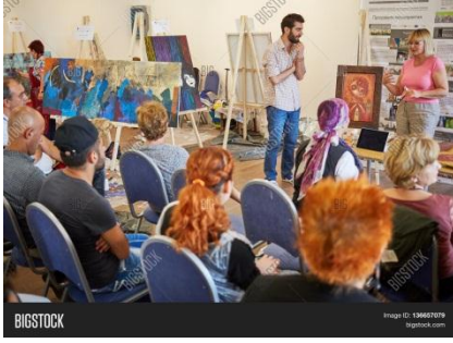
شكل ( 2 ) ملتقى في موسكو للرسم ، 2015