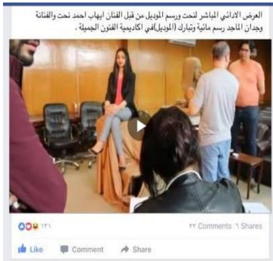
شكل ( 13 )