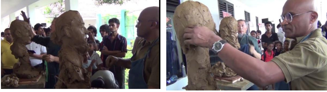
شكل ( 7 ، 8 ) فنانين اثناء انجازهما بورتريت لاحدهما الاخر ، 2014 ، سيريلانكا

ومن الجدير بالذكر إن هذه التجربة قد طبقت في كلية الفنون الجميلة / جامعة بغداد ، عام 2011 ، في إحدى قاعات الكلية ، عبر لقاء جمع بين أستاذين من أساتذة فرع النحت ، وبحضور طلبة قسم الفنون التشكيلية ، وقد تم تفاعل الطلبة بشكل كبير ، كونها تجربة حية تمنحهم مشاهدة مراحل عمل احترافية لانجاز ( Portrait ) عن أنموذج حي - ( شكل 9 ) .