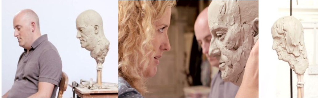
شكل ( 6 ) الفنانة الاميركية ( Amella Rowcroft ) اثناء عملها بتمثال عن موديل

أشكال الفن تولد من طرائق تقنية، ولكن أيضاً لأن جميع أنواع المفهوم الجمالي تستلزم مهارة تقنية في