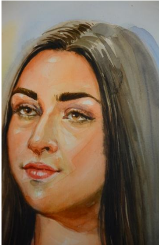
شكل ( 17 )