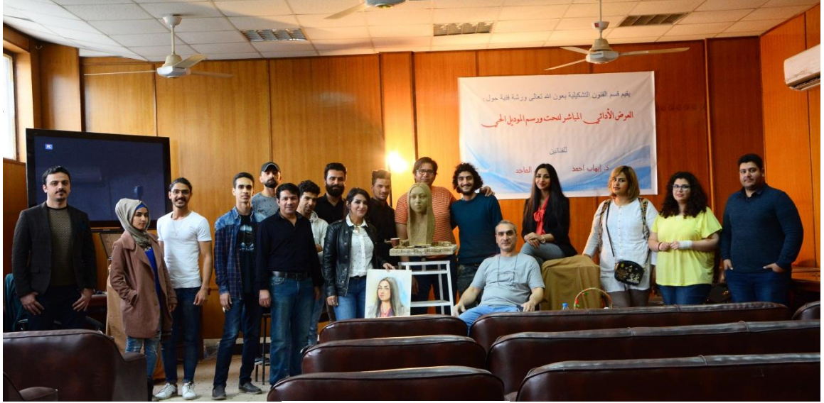
شكل ( 20 )