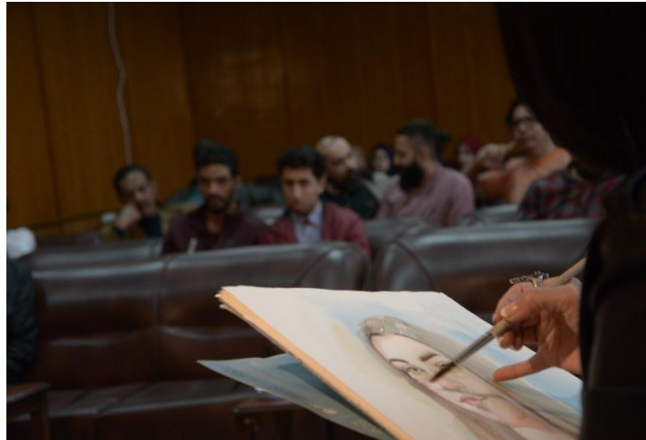
شكل ( 16 )