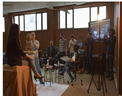
شكل ( 14 )