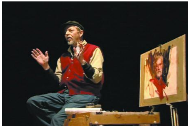
شكل ( 3 ) الفنان الأميركي ريشارد أثناء انجازه لوحة بورتريت بجلسة واحدة ، كليفورنيا

تعني كلمة ( alla prima ) - ( لأول مرة ) ، ومرادفتها باللغة الانكليزية ( First time ) ، وهو مصطلح تم استخدامه في الفن حديثاً للتعبير عن انجاز العمل الفني بجلسة واحدة ، لاسيما اللوحات التي يتجاوز فيها الرسام مرحلة التأسيس ، ليتم وضع الألوان فوق بعضها وهي طرية ، خلافاً لما هو معتاد حيث يجف لون لتضاف ألوان أخرى في مرحلة ما من مراحل العمل . ومن الجدير بالذكر قد كتب الفنان الأميركي المعاصر ( Richard Schmid ) عن هذا النشاط مؤلف الذي طُبع بجزئين كان عنوانه ( alla prima ) . تناول فيه كل ما يتعلق بحرفية الرسم وتجربته الفنية لهذا النوع من التشكيل ، اذ وصف هذه التجربة على انها طريقة للتفاعل الحي مع الموديل ، وتقنية تحتاج إلى براعة الفنان ، وسرعة في