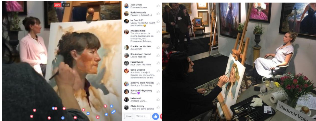
شكل ( 4 ، 5 ) الفنان الروسي ( فلاديمير فوليجوف ) اثناء انجاز بعض لوحاته ، نقل حي مباشر عبر موقع ( Facebook )

يتم عرض هذا النوع من التشكيل في صالات وقاعات مغلقة في الغالب ، مثل قاعات الدراسة العملية في الأكاديميات الفنية ، أو صالات عرض في الدور الثقافية والمؤسسات الفنية ، وبحضور جمهور ، حيث يتم توثيقها بوسائل السمعية والمرئية ( الكاميرا ) . وهنا يجد المتلقي مراحل العمل وأسلوب أداء الفنان عن كُتب ، وتمنحه هذه التجربة التفاعل الحي مع الفنان واللوحة ، وتحقق له متعة المشاهدة التي جاء لأجلها ، بوصفها تجربة حية غير تقليدية لطرائق عرض الفنون المرئية . وقد لجأ بعض الفنانين إلى وسائل التواصل الاجتماعي لنقل التجربة بتصوير حي مباشر ، حيث يتم تصوير الفنان وهو يقوم برسم لوحة عن موديل حي ، ونشر الفيديو على مواقع التواصل الاجتماعي لا سيما موقع ( Facebook ) ، ويتم تفاعل الجمهور مع هذه التجربة بوضع إعجابهم وتعليقهم ، ويتواصل معها الفنان في نفس اللحظة . كما في تجربة الفنان الروسي ( Vladimir Volegov ) ، إذ يتواصل مع الناس في هذه القناة الإلكترونية ، لينقل لهم حدث انجاز أعماله الفنية ، وليحقق متعة المشاهدة المباشرة من جهة ، والمساهمة في إكساب الخبرة للمبتدئين من جهة أخرى . ففي هذه التجربة يحصل المتلقي