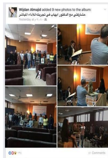
شكل ( 12 )