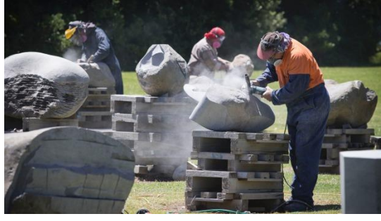
شكل ( 1 ) ملتقى في نيوزلندا للنحت على الحجر ، 2016

العالم أيضاً ، عبر مشاركة الفنانين من مختلف الجنسيات ، تحتضنهم الدولة المضيفة . وكذلك تتصف هذه الملتقيات بأنها ليس حكراً على أي فن من أنواع الفنون التشكيلية ، بل تقام ملتقيات للرسم أو النحت أو الخزف حسب ما يبتغيه منظم الملتقى - ( شكل 2 ) .