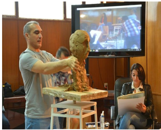
شكل ( 10 )