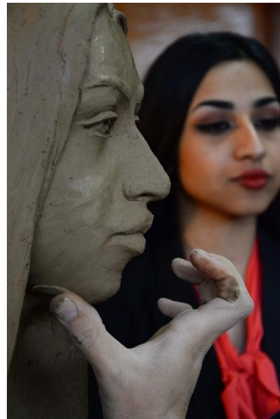
شكل ( 18 )