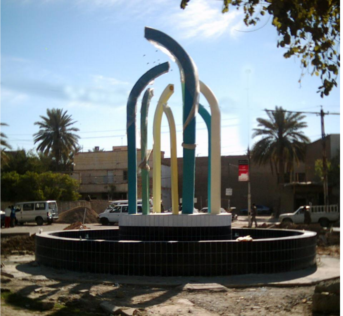
نصب ابواب الجنة في مدينة الكاظمية / باب الدروازة - ٢٠٠٦